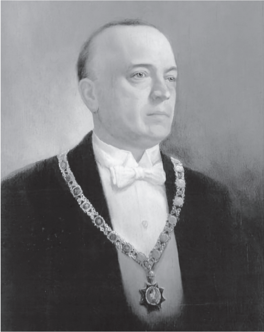
Slika 2. Portret rektora Sveučilišta u Zagrebu 1919./1920., 1924./1925. Ladislava Polića iz sveučilišne aule (HR-UNIZG-13.1.25, Zbirka umjetnina Sveučilišta u Zagrebu, Ladislav Polić, rektor 1919./1920.)